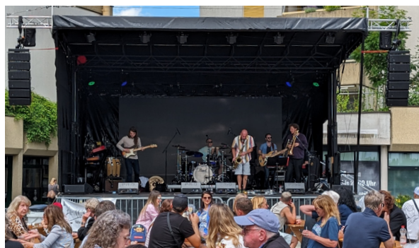
Am 21. Juni ist etwas los im Stadtzentrum: über 40 Stände von Betrieben und Organisationen, Food, Musik und vieles mehr laden zum Mitmachen ein.