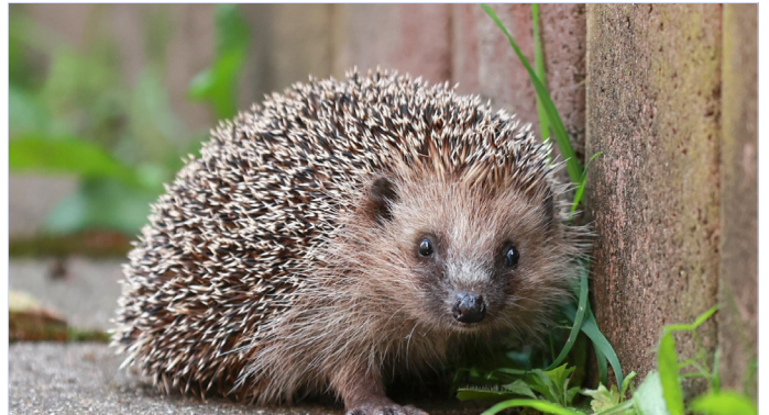
Igel schätzen das Leben in Siedlungen, aber fürchten Mähgeräte und Verkehr.

finden Igel dank Hecken und Gärten gute Verstecke. Jedoch bereiten ihnen Zäune Mühe bei der Nahrungssuche – hier hilft ein Abstand von mind. 10 Zentimetern zum Boden. Gefahren lauern für Igel im Verkehr oder von Mähgeräten. Mehr dazu: zimmerberg.wildernachbarn.ch/igel