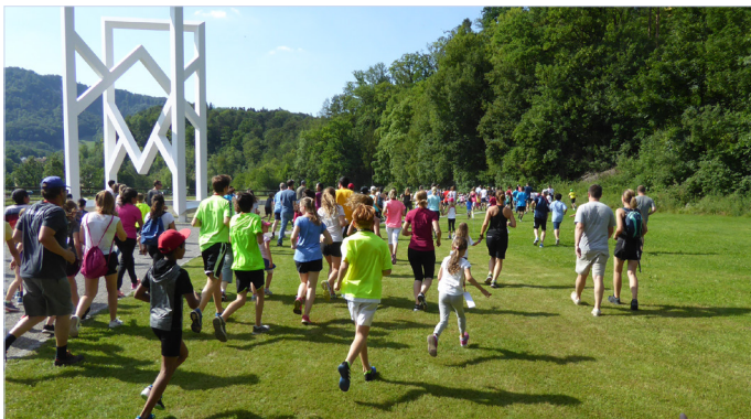
Der Schlusslauf startet am Freitag um 17 Uhr auf dem Schulareal Werd.

Vom 15. bis 19. Juni 2026 findet die «Adliswil bewegt sich»-Woche statt. Diese ist geprägt vom beliebten Klassenwettbewerb, vielfältigen Bewegungsangeboten der Vereine für Schulklassen sowie dem traditionellen Schlusslauf an der Sihl. Dieser ist für alle offen und findet am Freitagabend statt. Der Start erfolgt um 17 Uhr auf dem Areal des Schulhauses Werd. Dabei haben Angehörige sowie Bekannte die Möglichkeit, mitzulaufen und zusätzliche Runden zugunsten der Klasse der Schulkinder zu sammeln. Übrigens: «Adliswil bewegt sich» bereits seit 20 Jahren! Was 2006 entstand, ist immer noch aktuell: Sport verbindet, fördert die Gesundheit und stärkt das soziale Miteinander.