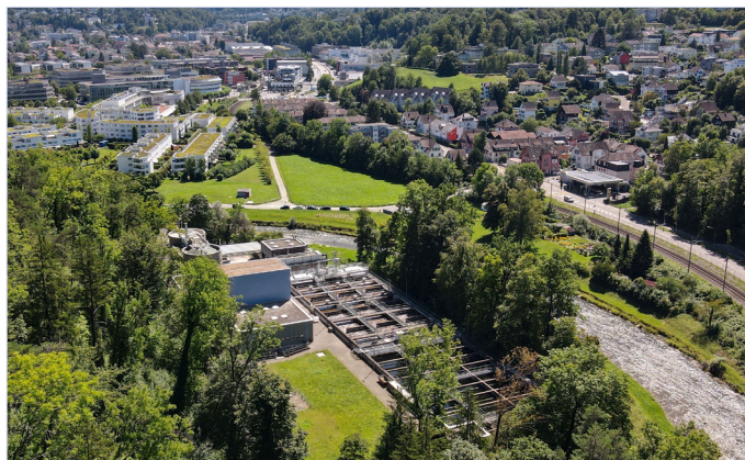
Die Abwärme der ARA Sihltal kann für den Wärmeverbund genutzt werden.

Der kommunale Energieplan weist Gebiete aus, in denen bestimmte erneuerbare Energieträger wie Abwärme, Erdwärme oder Energieholz bevorzugt genutzt werden sollen. Zudem zeigt er auf, wo Wärmeverbünde effizient betrieben werden können. Der im Sommer 2025 verabschiedete kommunale Energieplan integrierte die Klima- und Energieziele der Stadt Adliswil sowie das revidierte kantonale Energiegesetz. Nach der Festsetzung des Energieplans hat der Stadtrat nun die Vergabe einer Sondernutzungskonzession an Energie 360° beschlossen. Diese sieht den Betrieb eines neuen Wärmeverbunds für mehrere Quartiere im Talboden entlang der Sihl vor. Energie 360° präsentiert ein überzeugendes Versorgungskonzept, das den Anforderungen der Stadt Adliswil und ihrer Bevölkerung entspricht.