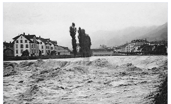
1910 führte die Sihl ein «Jahrhundert»-Hochwasser.