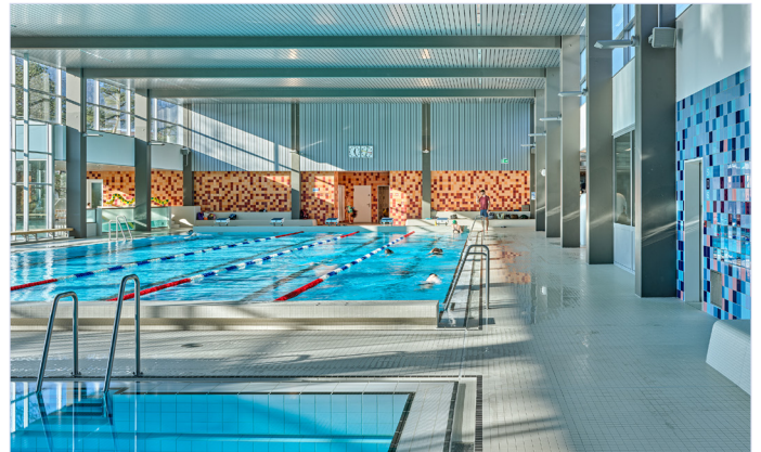
Seit der Sanierung 2021 lockt das Hallenbad mit bunten Farben.

Seit 1975 gehört das Hallenbad Adliswil zu den wichtigsten Treffpunkten für Sport, Freizeit und Begegnung in unserer Stadt. Ob Schwimmunterricht, Training oder Erholung – seit fünf Jahrzehnten bietet das Hallenbad Raum für Bewegung und Gemeinschaft. Am Samstag, 25. Oktober, wird das 50-Jahre-Jubiläum von 11 bis 15.30 Uhr mit abwechslungsreichen Aktivitäten im Wasser sowie einem Rahmenprogramm bis 17 Uhr gefeiert. Der Anlass wird gemeinsam mit dem Schwimmclub Sihlfisch Adliswil durchgeführt. Daneben warten Grill, Kuchen und Getränke auf alle Gäste. Die Bevölkerung ist herzlich eingeladen, das Jubiläum mit viel Action im und ums Wasser zu feiern. Der reguläre Schwimmbetrieb ist an diesem Tag bis 15.30 Uhr nicht möglich.