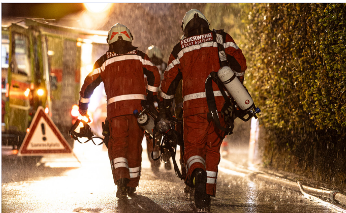
Bei der Freiwilligen Feuerwehr lernt man auch Wertvolles fürs eigene Leben.

Die Milizfeuerwehr Adliswil steht für Gemeinschaft, Hilfsbereitschaft und gelebten Teamgeist. Mitglieder lernen hier nicht nur, Verantwortung zu übernehmen und in Notsituationen zu helfen, sondern erwerben auch wertvolle Fähigkeiten fürs Leben: Ruhe bewahren, mutig handeln, technisches Wissen anwenden und im Team stark sein. Voraussetzungen für den Eintritt bei der Feuerwehr der Stadt Adliswil sind ein Alter zwischen 18 und 45 Jahren sowie Wohnsitz oder Arbeitsplatz in Adliswil. Wer mehr über dieses sinnstiftende und bereichernde Engagement zu Gunsten der Gemeinschaft erfahren möchte, ist herzlich zum Infoabend am 21. Oktober 2025 um 19 Uhr (Feuerwehrdepot, Tüfstrasse 4) eingeladen. Bei Grill und Getränken im Anschluss geben die Angehörigen der Feuerwehr gerne weitere Auskünfte. Aus organisatorischen Gründen wird um Anmeldung gebeten an: feuerwehr@adliswil.ch .