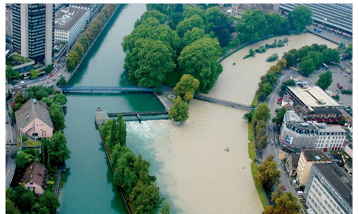
2005 gab es nur knapp keine grossen Schäden im Sihltal und in der Stadt Zürich.