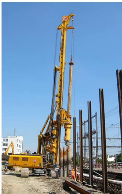
Drehbohrmaschine für die Träger des Schutzgerüsts. (Bild 2)