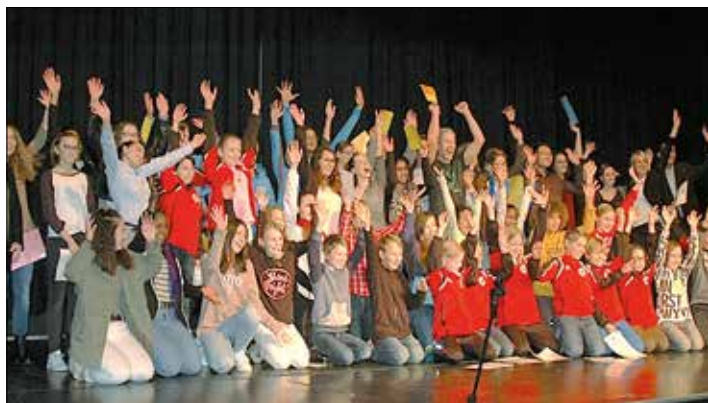
Am Abend der Sportlerehrung wurden Teams und Einzelsportler ausgezeichnet.