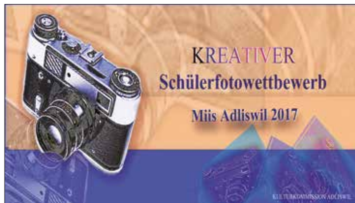
Schüler/-innen sind herzlich eingeladen, am Wettbewerb teilzunehmen.

turplatz-adliswil.ch geschickt werden. Anschliessend wird eine Jury 30 Fotos auswählen, die vom 12. bis 14. Mai im Haus Brugg ausgestellt werden. Als Höhepunkt des Wettbewerbs werden am 14. Mai 2017, 16.00 Uhr, neun Fotos prämiert. Die Kulturkommission freut sich auf tolle Fotos und viele Besucherinnen und Besucher an der Fotoausstellung im Haus Brugg.