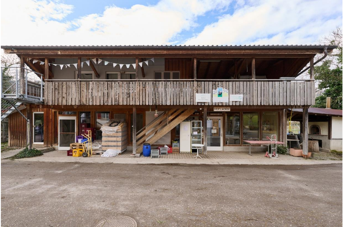
Abbildung 4: Ökonomiegebäude (Nr. 18.2) mit Sicht auf Hofladen

Das Ökonomiegebäude wurde im Jahr 1917 als eine Remise errichtet, in der Zwischenzeit etappenweise umgebaut und derzeit für mehrere Funktionen genutzt. Ebenerdig befindet sich der Hofladen, die Molkerei (nur Milchaufbereitung -> keine Käseerei) und das «Reiterstübli». Im Obergeschoss befinden sich 2 einfach ausgestattete Angestelltenzimmer und eine Restfläche zur Nutzung als Lagerfläche.