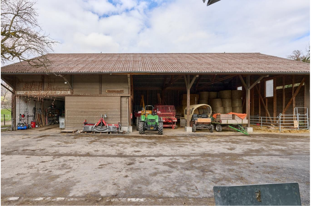
Abbildung 5: Remise (Nr. 18.5) mit Blick auf Werkstatt (linke Seite) und Maschineneinstellraum (rechte Seite)

Die Remise wurde im Jahr 1997 errichtet und ist mit einer Werkstatt und einer rund 270 m 2 grossen Maschineneinstellfläche ausgestattet. Oberhalb der Werkstatt befindet sich ein ursprünglicher Lagerraum der zu einem einfachen Massengericht für das Angebot «Schlaf im Stroh» umgebaut wurde. Auf der nördlichen Seite der Remise ist ein einfacher Ponyunterstand (für ca. 5 Ponys; inkl. Auslauf) und ein einfacher Maschinenunterstand von 26 m 2 angebaut.