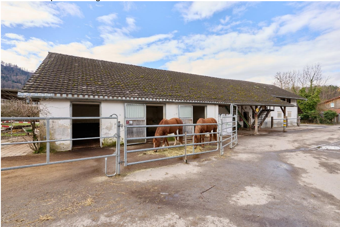
Abbildung 6: Pferdestall (Nr. 18.4) mit Blick auf Pferdeboxen inkl. Auslauf.

Der Pferdestall (Baujahr unbekannt) verfügt über 11 Pferdeplätze. Davon werden 9 Pferde in Gruppenhaltung (inkl. Auslauf) und zwei Pferde in Pferdeboxen (inkl. Auslauf) gehalten. Des Weiteren verfügt das Gebäude im Erdgeschoss über eine einfache Sattelkammer und im Oberschoss über einen einfachen Lagerraum. Ein rund 820 m 2 grosser Reitplatz befindet sich praktisch angrenzend nordöstlich des Pferdestalls.