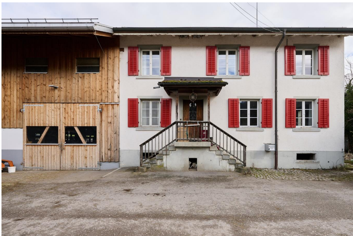
Abbildung 3: Wohnhaus Nr. 18 mit angebauter Scheune

Das Wohnhaus Tüfistrasse 18 wurde im Jahr 1880 errichtet, ist ein Massivbau aus Bruchsteinmauerwerk und Holzbalkendecke und verfügt über eine Wohnung, die sich über zwei Geschosse verteilt. Im Erdgeschoss befinden sich: 1 Küche, 1 Wohnstube, 1 Badezimmer und 1.5 Zimmer. Das Obergeschoss verfügt über 1 einfache Kücheneinrichtung inkl. Wohnraum, 3 Zimmer und 1 Badezimmer. Zudem verfügt das Wohnhaus über einen Estrich und über einen Keller im Untergeschoss.