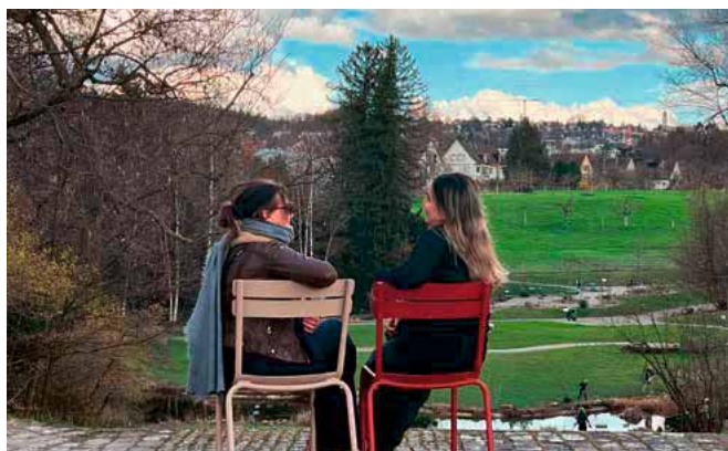
Ein Tandem unterhält sich im Alten Botanischen Garten.

www.gemeinsam-hier.ch , 078 209 74 33, gemeinsam-hier@vsjf.ch